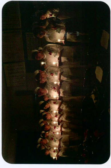
< 戴帽式 >