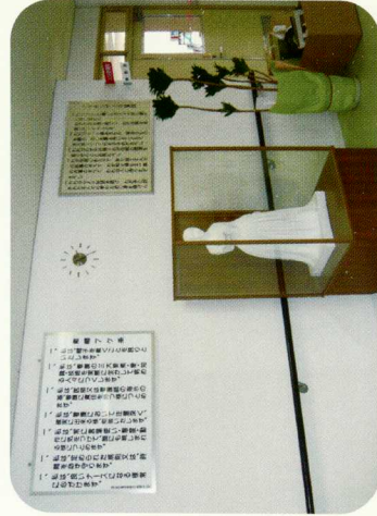
< 玄関ホール >