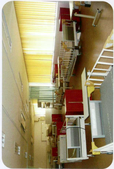
< 実習室 >