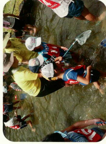
< サマーカーキヤンプ（実習） >